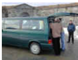
Minibussen ble stappende full.