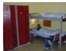
Flott innkvartering med (nesten) egne rom