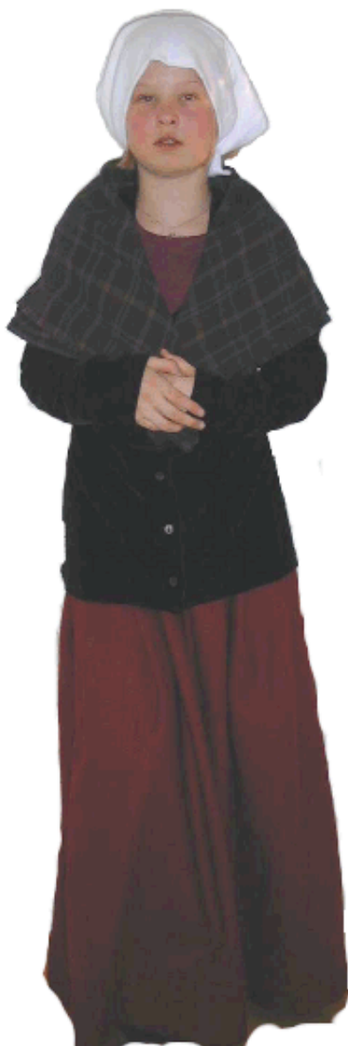
Fin pie, ikke sant?