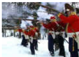
Nordenfieldske Grenaderer Anngriper de svenske styrkene.