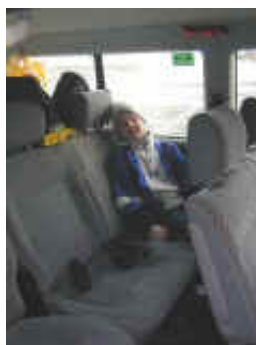
Klar til å reise, første helgatur med pappas compagnie! :-)