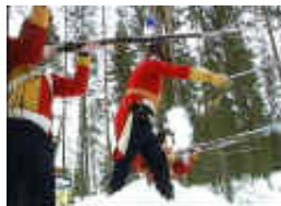
Dreyer på stubben gir ordre om ildgivning til sine grenaderer.

Her følger resten av artikkelen Østlendingen hadde i sin nett-avis. (Håper de tilgir oss for å gjengi artikkelen her.)